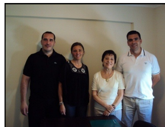
Los directivos de G-SE en su oficina de Córdoba, con la Directora del Área.