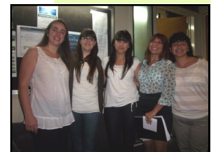
Las Licenciadas. en Enseñanza de la Matemática.