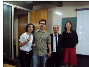
Lengua y Comunicación

nos de Tucumán, Buenos Aires, Chaco y Santa Fe. Algunos de los testimonios gráficos y textuales están en esta página, pero lo más bello quedó en nosotros. Gracias por elegirnos, queridos graduados.