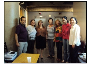
Un grupo de Biología