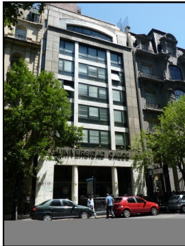
Entramos a U.CAECE