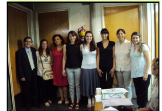
We speak English

Nada es más importante en educación a distancia que lograr la cercanía entre profesores y alumnos, entre los mismos alumnos y entre todos ellos y la institución. Cuando vienen los alumnos a graduarse, comprobamos si lo hemos logrado.