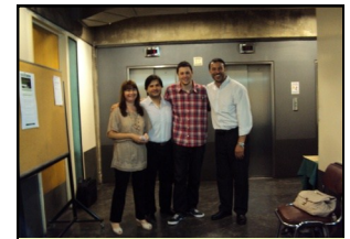
Licenciados en Enseñanza de la Lengua y la Comunicación